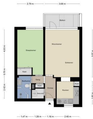
Aan de plattegronden kunnen geen rechten worden ontleend © Zibber www.zibber.nl